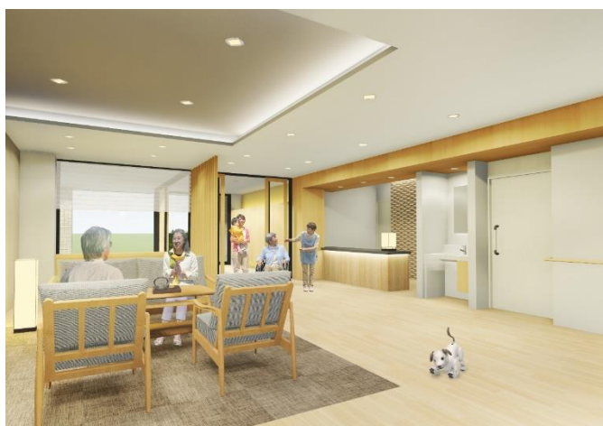
< 1F ラウンジ >