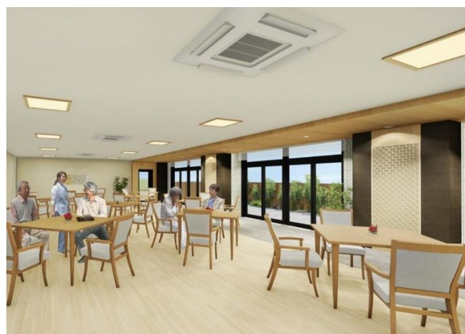
< 1F ダイニング (食堂) >