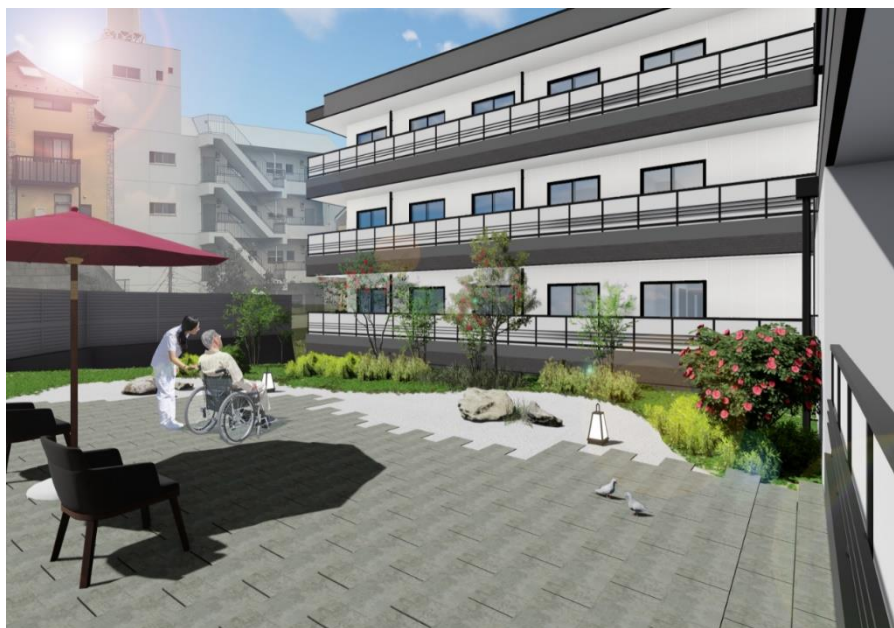
< ガーデンテラス (庭園) >