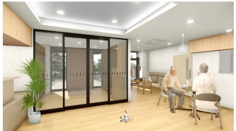
<エントランスラウンジ>