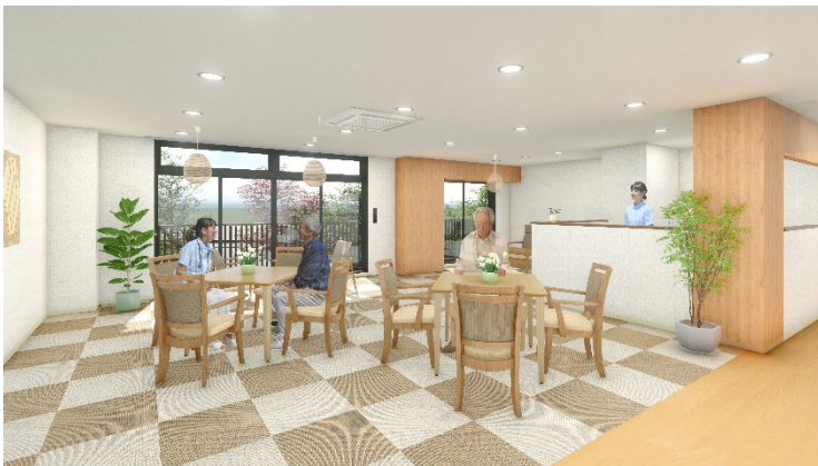
<リビング(談話スペース)>