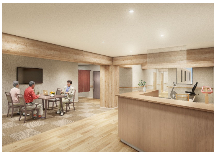
<リビング(談話スペース)>