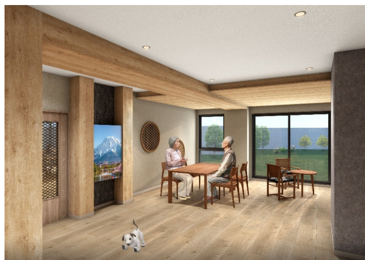
<エントランス ラウンジ>